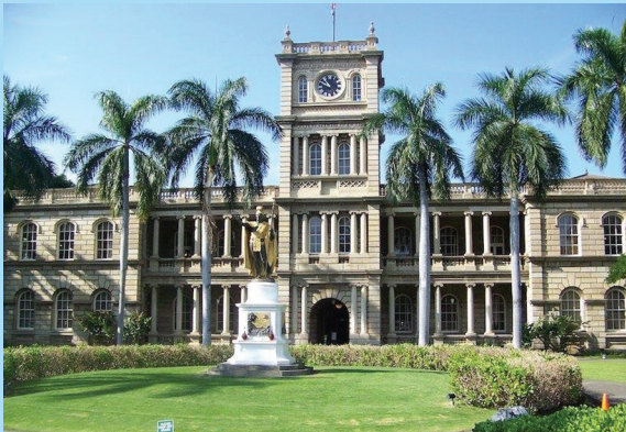
The Supreme Court of Hawaii

税理士法人 山田 & パートナーズ Yamada & Partners Tax Corporation