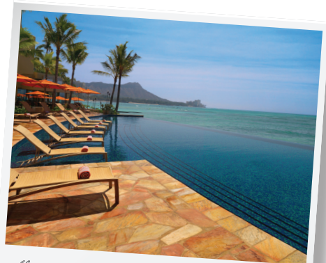
Sheraton Waikiki infinity pool

Please send an email to info@hitaxinstitute.org to receive announcements and future brochures by email.