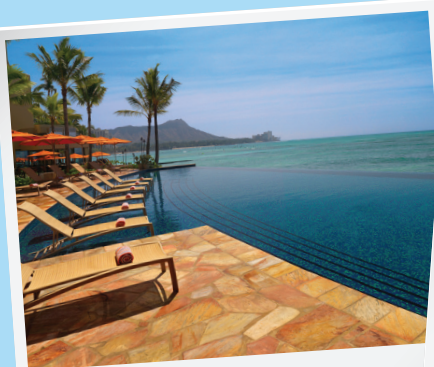
Sheraton Waikiki infinity pool

Eメールによる通知・将来のパンフレットをご希望の際、 info@hitaxinstitute.org にメールにてリクエストをお願い致します。