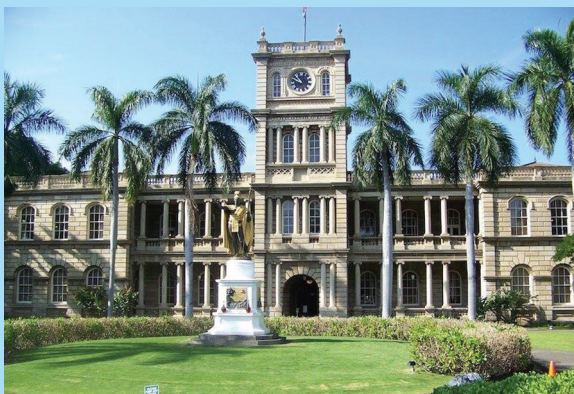
The Supreme Court of Hawaii