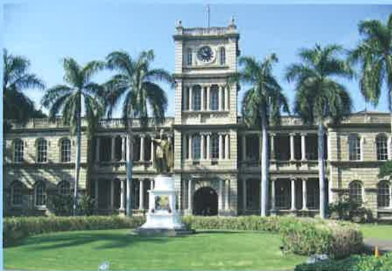
The Supreme Court of Hawaii

Los Angeles County Bar Association Business Law Section